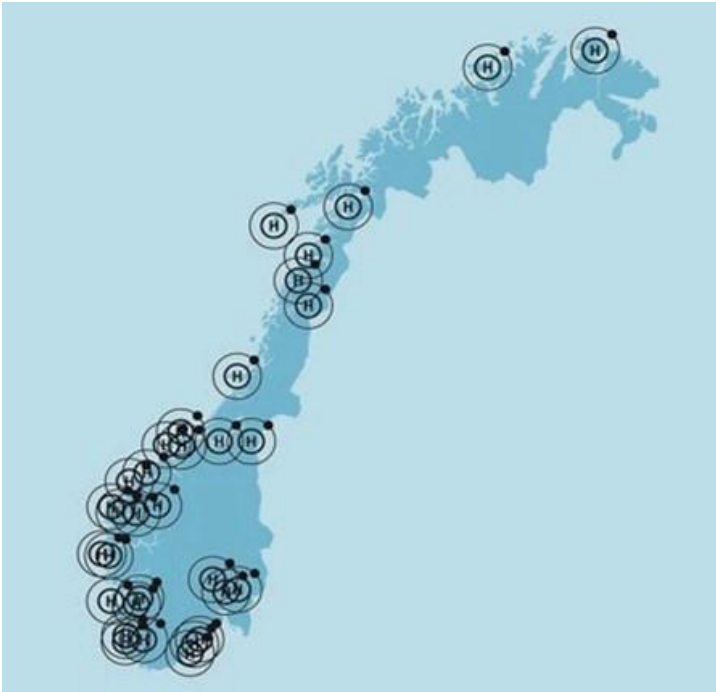
Figur 1 Kart fra Stortingsmelding nr 36 (2020 – 2021) Energi til arbeid – langsiktig verdiskaping fra norske energiressurser.

En rapport fra NHO, «Grønne elektriske verdikjeder», handler om å videreutvikle de fortrinnene vi har innen fornybar energi basert på samspill og synergier med den øvrige industrien, inkludert olje- og gassnæringen. Troms og Finnmark er en stor produsent av energi, både fornybar energi (vind- og vannkraft), samt olje og gass. Regionen har derfor gode forutsetninger for å bli en stor produsent av både blått og grønt hydrogen. Forventet produksjon av hydrogen antas å overgå det regionale behovet. Produksjonen vil derfor gå til både det regionale forbruket, samt til eksport.