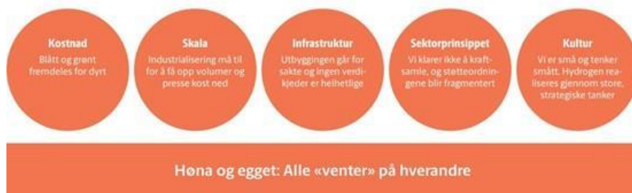
Figur 4 Fra H2 Cluster Hydrogen: Store muligheter, dårlig tid.

Utfordringene som pekes på er også gjeldende i Troms og Finnmark. Kostnadene og risikoen forbundet med å gå inn i hydrogenmarkedet, både som produsent og forbruker, er i dag for stor.