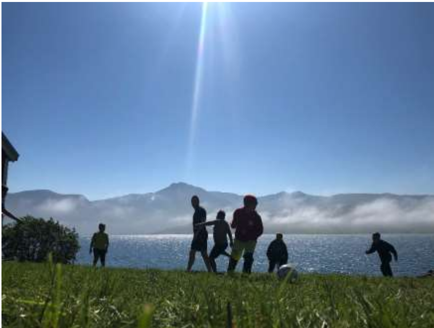
Sommerdag ved Bygdetunet.

Vi skal fortsatt levere så gode tjenester til innbyggerne at vi kan bestå som Kvæfjord kommune. Men vi vil også være tydelige på hva vi ønsker for fremtiden i kommunen vår, og hvordan vi vil utvikle Kvæfjordsamfunnet.