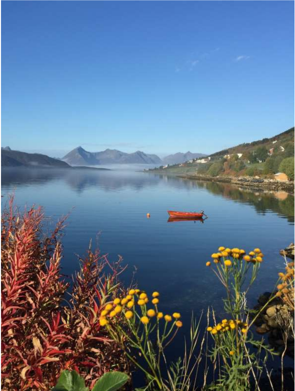
Utsikt mot Godfjordalpen.