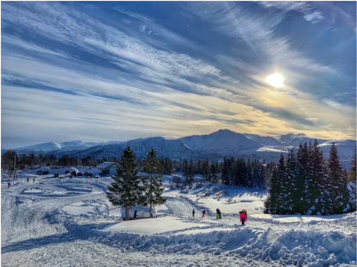
Aking ved Skytterbanen.

Medvirkning med innbyggere skal være en forutsetning for våre tjenester. Som organisasjon, arbeidsgiver og tjenesteyter skal samhandling prege vårt arbeid og hvordan vi løser oppgaver i kommunen i årene som kommer.