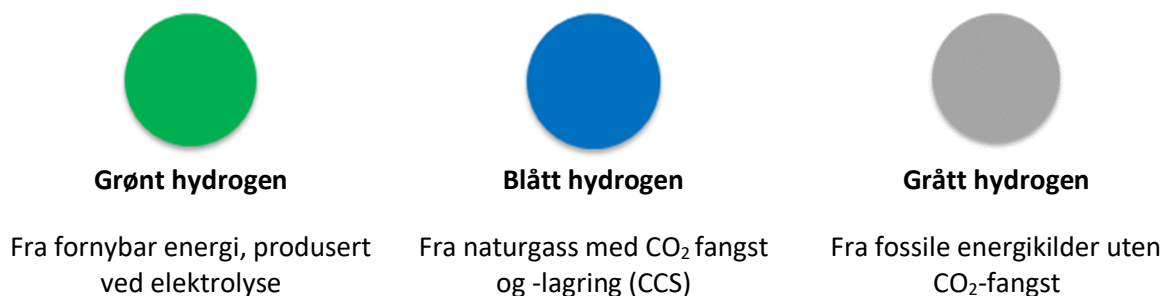
Figur 2 Fra Evig Grønn "Statusrapport for hydrogen"

Den norske regjeringen satser på en produksjon av både på blått og grønt hydrogen, mens eksempelvis EU prioriterer grønt hydrogen. Basert på teknologi så er storskala produksjon av både blått og grønt hydrogen mulig. Utfordring ved produksjon av blått hydrogen er knyttet til fangst og lagring av CO 2 (CCS). I Norge er ett av to kjente lagringingsfelt i Barentshavet.