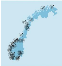
Figur 1 Kart fra Stortingsmelding nr 36 (2020 – 2021) Energi til arbeid – langsiktig verdiskaping fra norske energiresurser.

Det er stor nasjonal og internasjonal aktivitet innen hydrogen. Kartet nedenfor viser nasjonale prosjekter. Det er pt få prosjekter i Troms og Finnmark, men de to som er omtalt er til gjengjeld store og «modne» prosjekter, også i europeisk sammenheng. Erfaringer og kompetanse fra de blant annet de to pågående hydrogenprosjektene er del av kunnskapsgrunlaget for strategien 1 .