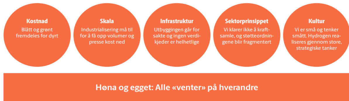
Figur 4 Fra H2 Cluster "Hydrogen: Store muligheter, dårlig tid".

Utfordringene som pekes på er også gjeldende i Troms og Finnmark. Kostnadene og risikoen forbundet med å gå inn i hydrogen markedet, både som produsent og forbruker, er i dag for stor.